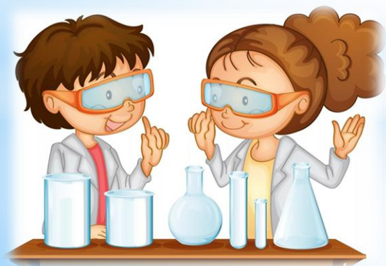
эксперимент с водой.